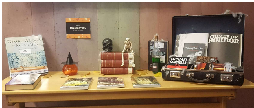
Hrekkjavökustemming á safninu í nóvember

heitir Sierra og er frá Innovative. Í byrjun árs var svo tilkynnt að Ex Libris hefði keypt Innovative en kaupin raska innleiðingu kerfisins en leitargáttin sem stóð til að nýta með Sierra verður ekki þróuð meir. Stefnt var á að taka kerfið í notkun í upphafi árs 2021 en þessar hrókeringar munu að öllum líkindum raska því. Lánþegar ættu þó ekki að finna mikið fyrir þessum breytingum en nýja kerfið ætti að vera mun notendavænna fyrir starfsfólk bókasafna.