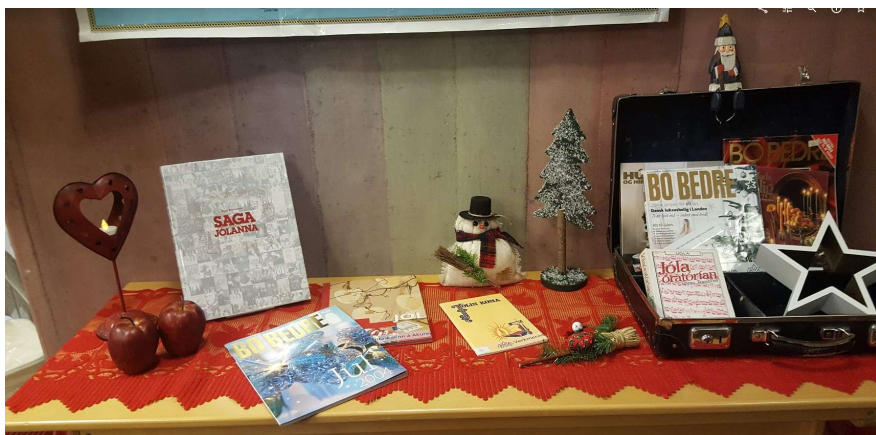
Bókasafnið í jólaskapi

Töluvert er um að starfsfólk bókasafnsins tíni til á bókavagna safnefni fyrir einstaka verkefni og ritgerðir og þá er það efni nýtt á safninu án þess að það fari í formleg útlán og telji í tölfraeðinni. Þetta sparar nemendum vinnu við að finna sjálfir til heimildir og tryggir að allir nemendur hafi jafnan aðgang að efnum, en ekki er reiknað með að nemendur fái safnefni í útlán ef efnið er á vagni og fleiri þurfi að nota það.