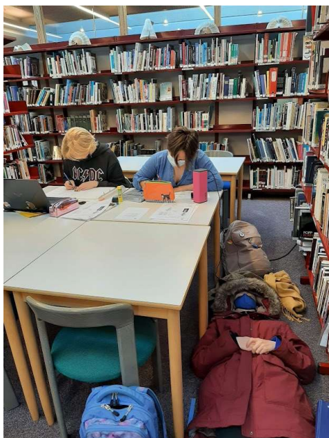
Sumir að læra og aðrir að hvíla sig

Eitthvað er um að starfsfólk bókasafnsins tíni til á bókavagna safnefni fyrir einstaka verkefni og ritgerðir og þá er það efni nýtt á safninu án þess að það fari í formleg útlán og telji í tölfræðinni. Þetta sparar nemendum vinnu við að finna sjálfir til heimildir og tryggir að allir nemendur hafi jafnan aðgang að efninu, en ekki er reiknað með að nemendur fái safnefni í útlán ef efnið er á vagni og fleiri þurfi að nota það.