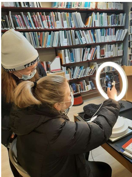
Nemendur að prófa áhrifavaldaljósð

skólaár hefst svo á innleiðingu í framhaldskólum þannig að það verður spennandi að spreyta sig í notkun á nýju kerfi í haust. Starfsmenn safnsins hafa sótt sótt námskeið og fræðslufundi um nýja kerfið og lofar það góðu. Vinna við kerfisskiptin er umfangsmikil bæði grunnuppsetning, gagnahleðslur og prófanir taka sinn tíma. Landskerfi bókasafna stýrir þessari vinnu með hjálp starfsmanna safnanna sem hafa boðið sig fram í setu í innleiðingar- og stýrihópum. Nýja kerfið er heitir Alma og er frá Ex Libris en við munum áfram nota sömu leitargátt frá Primo VE í viðviðmóti. Lánþegar ættu þó ekki að finna mikið fyrir þessum breytingum en nýja kerfið ætti að vera mun notendavænna fyrir starfsfólk bókasafna.