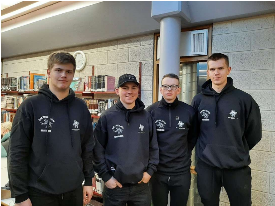
Véltjórnarnemendur á góðri stund.

Í vetur komu nokkrir hópar til okkar í heimildaskráningarverkefni í íslensku. Verkefnið var í formi ratleiks þar sem nemendur þurftu m.a. að nota QR kóða, fletta bókum og tímaritum til að skrá heimildir. Það var gaman að hafa